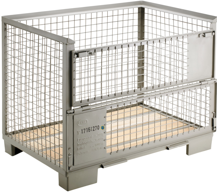
Palet Box EPAL