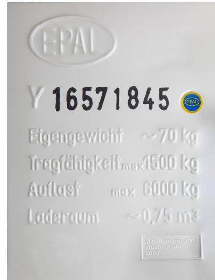
Palet Box EPAL (placa de inscripción)